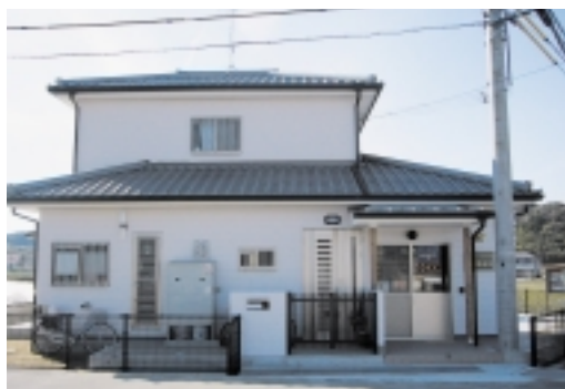
▲開所した筒井駐在所