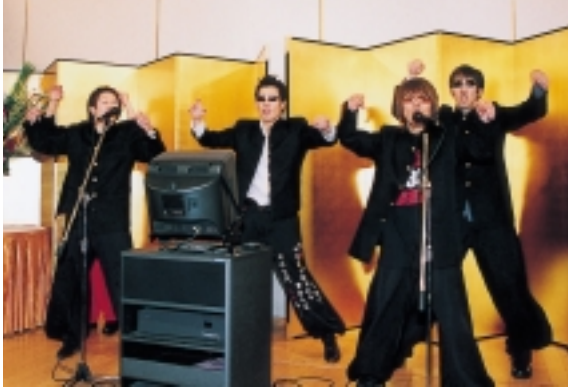
▶歌もダンスもノリノリ