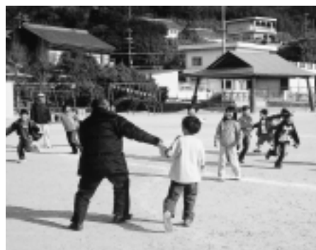
▲おにごっこでふれあい

小学校運動場で、老人会の方々とおにごっこ、こままわし、リングころがしの手ほどきを受けました。