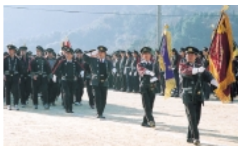
▲堂々と行進する消防団員の皆さん