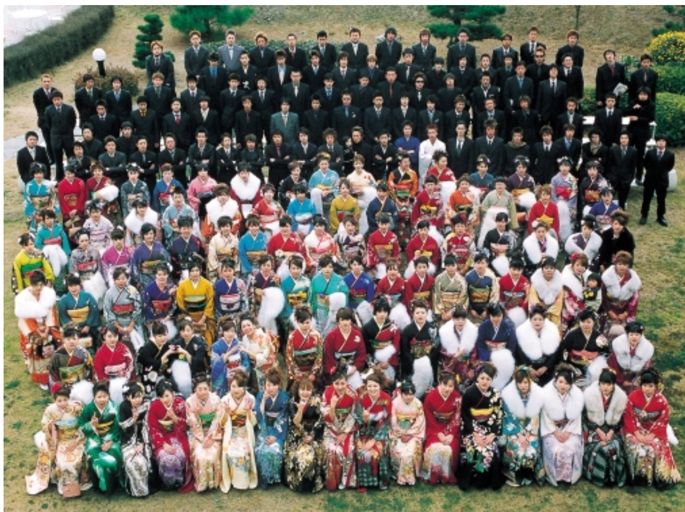
新成人のみなさん（1月11日成人式）