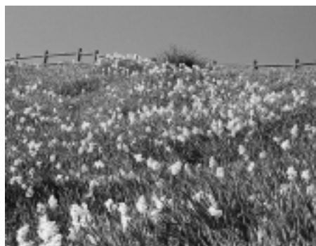
▲水仙郷(1月上旬撮影)