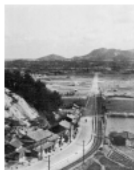
▲昭和35年頃、中山峠から1500m。淡路島では最長の直線国道であった(国道28号)。

〒656-0592 南淡町福良甲512番地 南淡町役場 町長公室 ☎50-2501