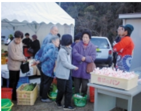
▲旬の美味しいものを求めて大勢訪れました

また、ちびっ子にはカラフルな風船が、買い物をした方にはポン菓子が配られ、思いがけないプレゼントにみんなニコニコ顔でした。